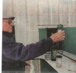
Betty box récupère les déchets recyclables.

Albi. Deux Betty box sont installées à Albi et Saint-Juéry. Elles récupèrent les déchets recyclables : verre, plastique, aluminium, acier. Chaque apport est rémunéré. Lorsque le cumul des dépôts atteint 15€, un virement est effectué automatiquement. Au delà de l'Albigeois, la Betty box intéresse les supermarchés, les communautés urbaines mais aussi les Chinois et les Chiliens. Page 23